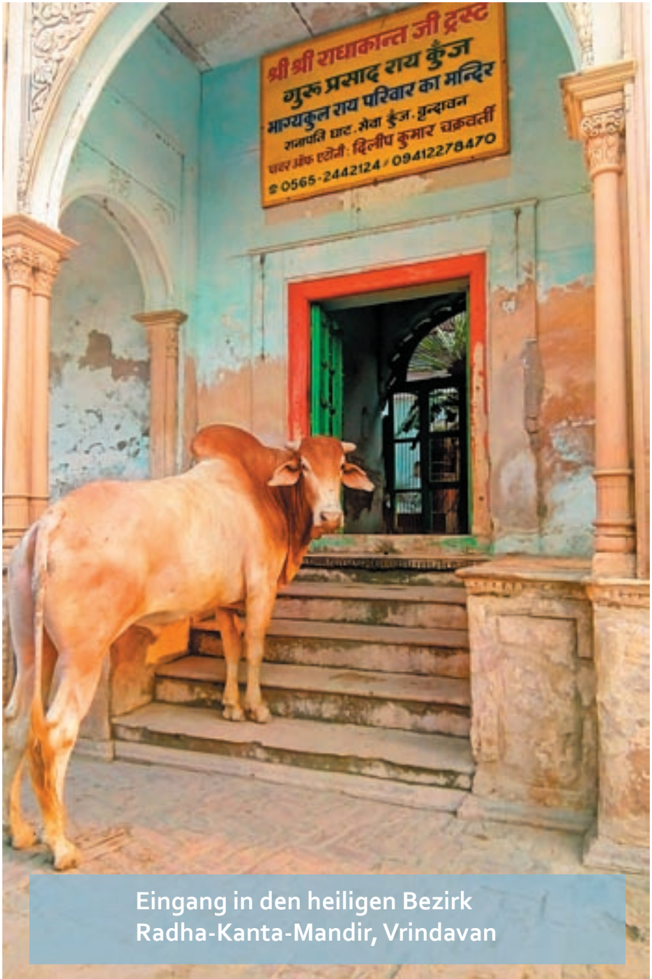
Eingang in den heiligen Bezirk Radha-Kanta-Mandir, Vrindavan