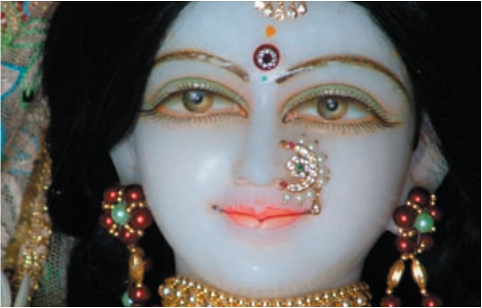
Foto: Vrinda Devi, Vrinda Kunda, Vrindavan

„O meine liebe Freundin Vrinda, woher kommst du?“ „Ich komme von den Füßen Sri Haris.“ „Wo ist Er?“ „Im Wald, am Ufer des Radha-kun- da.“ „Was tut Er dort?“ „Er lernt tanzen.“ „Wer ist Sein Meister?“ „Dein Ebenbild, Radha, das sich